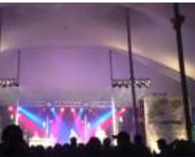
Festival de l'érable

Comment égayer votre passage dans L'Érable? Choisissez de vivre la culture de notre région par ses festivals : spectacles de tous les styles musicaux, parades, rodéos, expositions d'art et de métiers d'art, mise en valeur du patrimoine, dégustations et bien plus ! Les visiteurs affluent de partout pour venir découvrir nos festivals. Ça bouge dans la région de L'Érable!