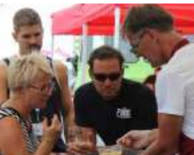
Foire bières bouffe culture