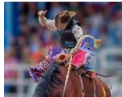
Festival du cheval