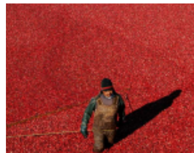
Canneberges en fête