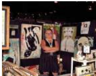
Symposium d'art Lyst'Art