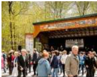
Festival des Sucres