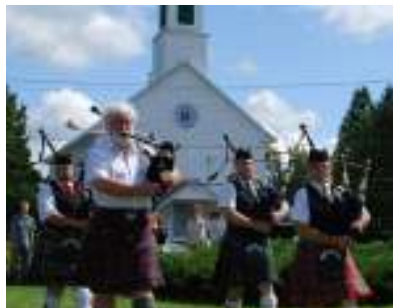
Festival de musique celtique