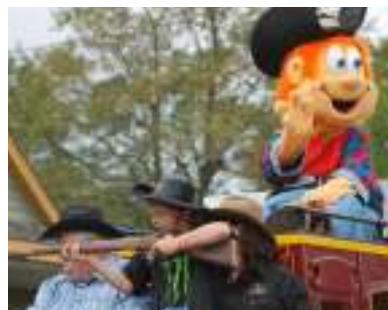
Festival du boeuf