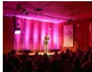
Festival contes légendes